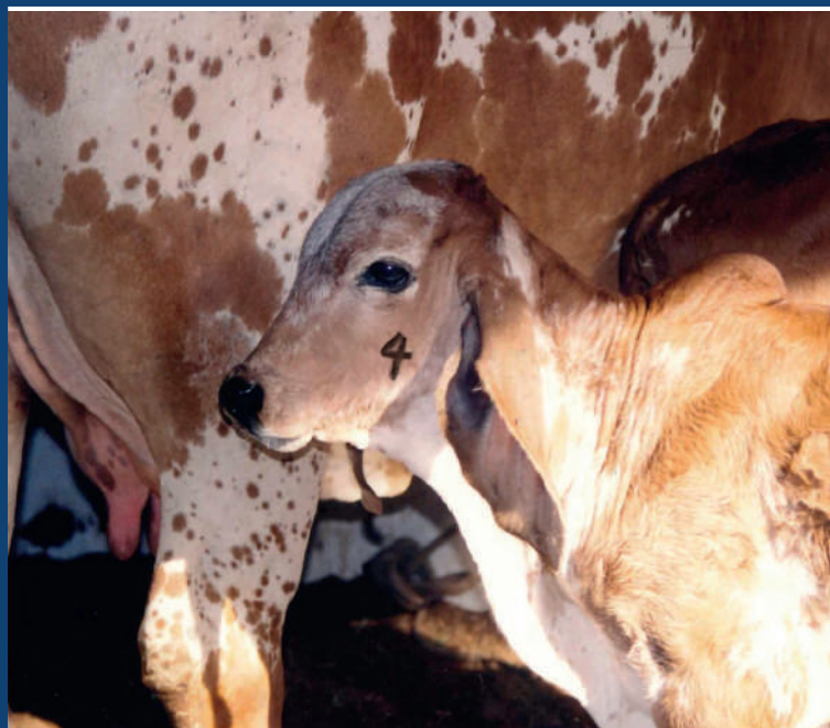
Identificação das fêmeas vacinadas com a vacina B19

Para mais informações, procure uma unidade da Agência IDARON ou entre em contato: