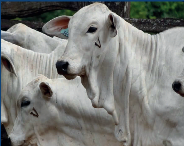
Identificação das fêmeas vacinadas com a vacina RB51

As fêmeas vacinadas com a vacina RB51, deverão ser marcadas a ferro candente com a letra V, no lado esquerdo da cara.