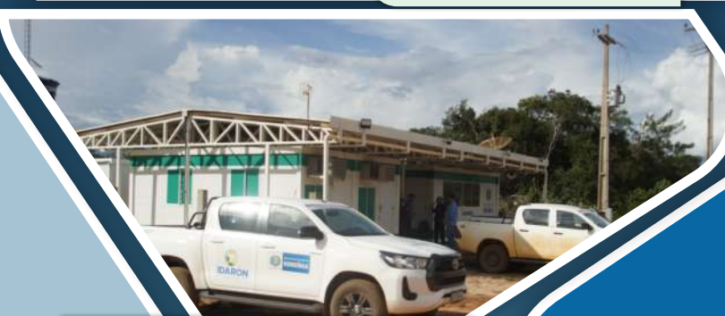
BR-174 / VILHENA / JUÍNA