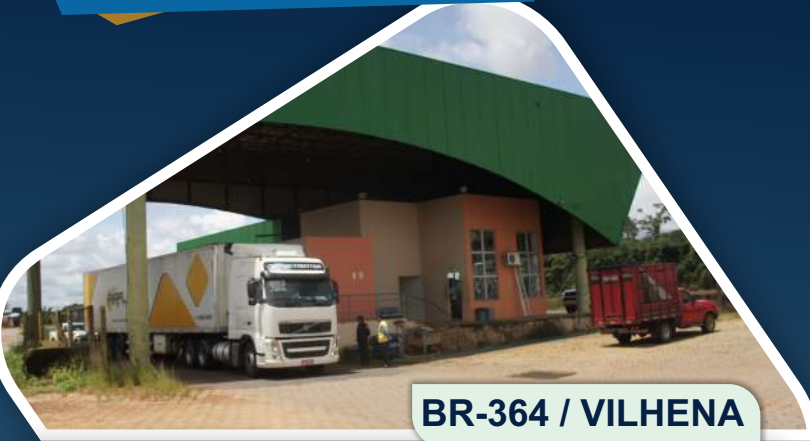
BR-364 / VILHENA