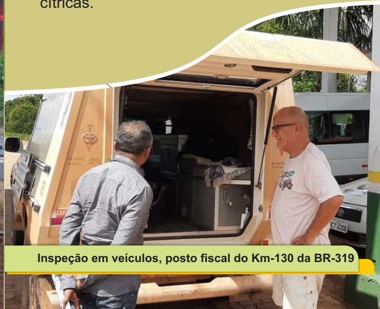
Inspeção em veículos, posto fiscal do Km-130 da BR-319

Na interceptação de produtos sem documentação que comprove sua origem e sanidade são aplicadas medidas fitossanitárias de trânsito: