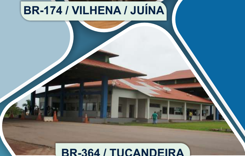
BR-364 / TUCANDEIRA