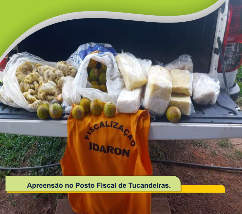
Apreensão no Posto Fiscal de Tucandeiras.

Em Rondônia, é feita a fiscalização interestadual em postos de barreiras fixas nas divisas com os estados do Amazonas, Acre e Mato Grosso e fiscalização internacional nos rios limítrofes a Bolívia.