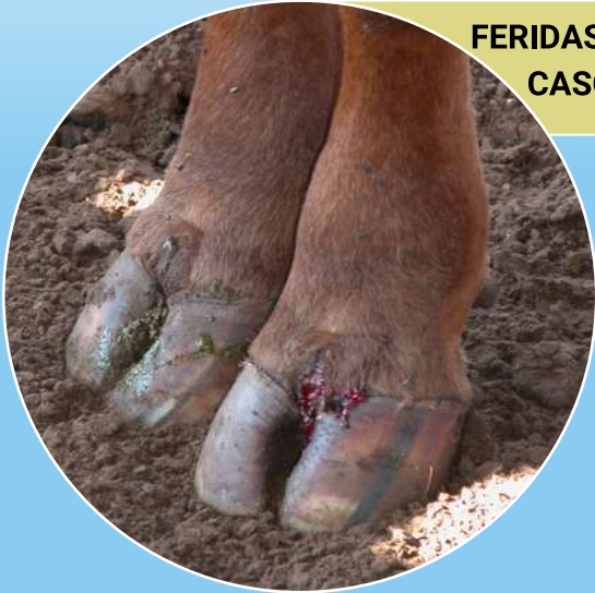
FERIDAS NOS CASCOS

Mantenha os olhos atentos à esses sinais