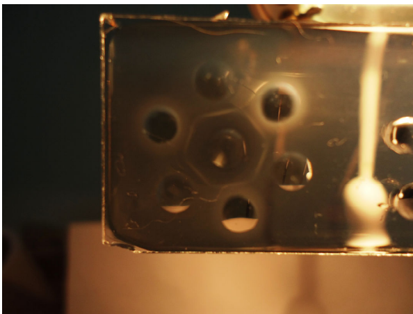
Figura 7- Leitura do exame

Foto do refrigerador, para pinamento do lacre n° 0000652 e retirada de dez amostras para pasta-rosa. Com finalidade por fazer-se as análises no gel a 1%. As parafusadas do gel foram retiradas imediatamente com broca de vidro. O peso a ser testado foi distribuído colocando 2,5 microlitros (µl) na parafusada (1) e 2,5 microlitros (µl) na parafusada (2). O restante foi colocado com 2,5 microlitros (µl) na parafusada (3). O restante foi colocado com 2,5 microlitros (µl) na parafusada (4). No restante a lâmina foi colocada em câmara úmida para incubação e lacrada com o n° 0000039 pelo Técnico do Idaron. O peso testado foi armazenado com as demais amostras, lacre molado e lacrada com o novo lacre. A lâmina foi colocada para incubar por 48 horas para posterior leitura. No dia 10 de junho de dois mil e onze, na presença da Dra. Alessandra M. de Souza (Idaron) e o Dr. Vinícius Alves Gomes fez-se a leitura da pasta-rosa. Os exames de n° 012424 e n° 012425 saíram positivos. Não houve mais a realizar os presentes testes assinando: