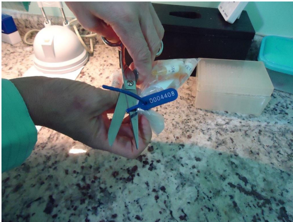
Figura 3- Deslacre da amostra