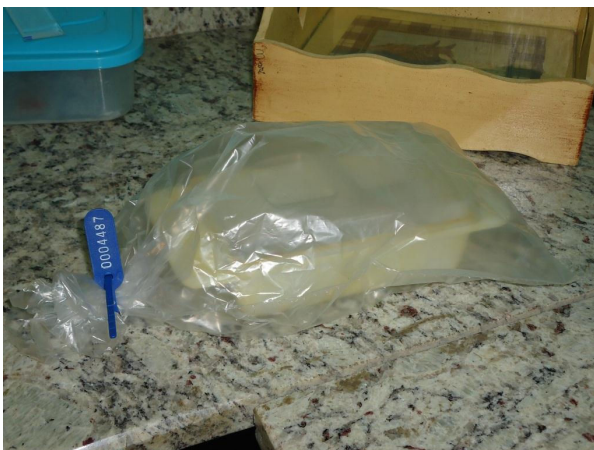
Figura 5- Lacre da câmara úmida