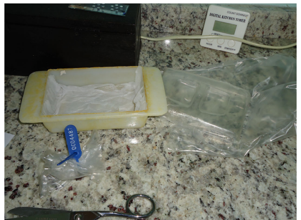
Figura 6- Deslacre da câmara úmida